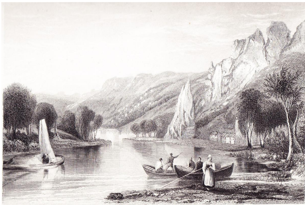
D I N A N T .

« Dinant », entre les pages 44 et 45 de Belgium & Nassau (1838)